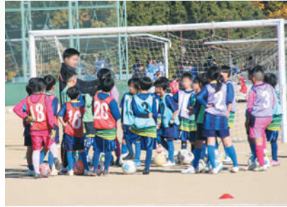
ジュニアサッカー大会

地域の小学生を対象とした軟式野球大会です。地域の野球チームが参加し、スポーツを通じた子どもたちの健全育成と管内の地域活性化を目的としています。