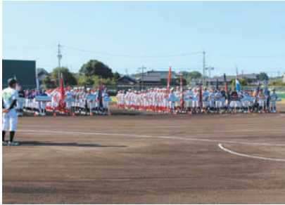
学童軟式野球大会

さまざまなふれあい活動を通じて地域の方々との絆を育むとともに、 子どもたちの健全な育成や食農教育にも力を注いでいます。