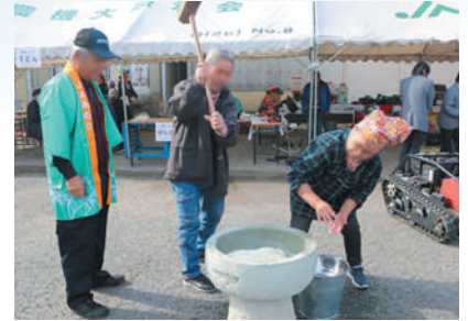
地域ふれあい活動

JAみのりの主催で実施する地域の小学生を対象とした大会です。地域活動の一環として行い、子どもたちの育成や地域交流を目的としています。