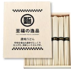
至福の逸品 木箱入り讃岐うどん8束