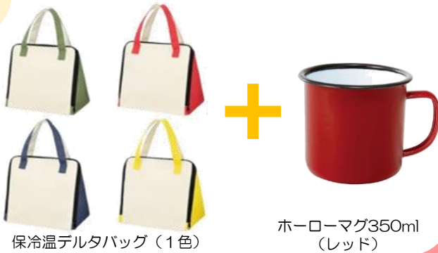
保冷温デルタバッグ（1色）