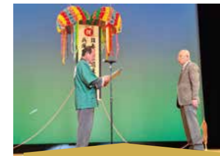
多可町日本酒フェスタ

美囊地区酒米協会は、「美囊地区酒米生産者大会」を開催しています。地元生産者や三木市産山田錦を使って酒造りを行う酒蔵などが出席し、次年度の良質米生産に向けて、意識を高めています。