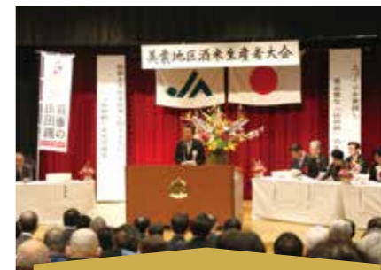
美囊地区酒米生産者大会

加東酒米部会では「加東酒米生産者大会」を開催しています。地元生産者をはじめ、加東市産山田錦を使って酒造りを行う酒蔵などが出席し、栽培技術や品質向上と契約数量の確保に向けて、意思統一を図っています。