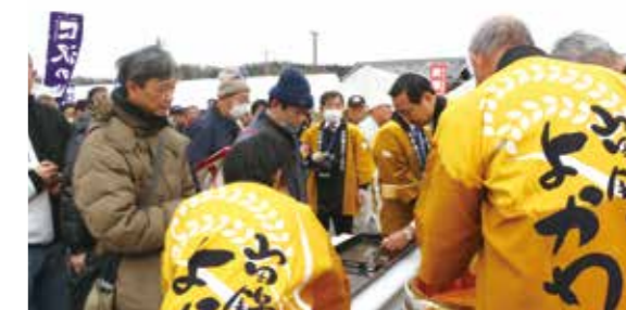
鏡開き後には樽酒が振る舞われました

3月8日、9日、三木市吉川町吉安の山田錦の館で「第30回山田錦まつり」が開かれました。酒蔵と生産者が各蔵自慢の銘酒の試飲・販売ブースを出店し、吉川町産「山田錦」で醸した日本酒と山田錦の魅力を来場者へPR。30回目を記念し、シャンパーハットのでつじさんによる日本酒トークショーや大抽選会なども行われ、大人から子どもまで楽しめるイベントとなりました。