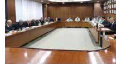
今後の生産振興について意見交換

3月5日、山田錦生産者とJA役職員らが意見を交わす山田錦部会代表者会議を本店で開催しました。各地区の山田錦部会の代表者をはじめ、全農、JAみのりの役職員が出席。酒造用米の情勢報告や7年産山田錦の生産計画などについて話し合いました。