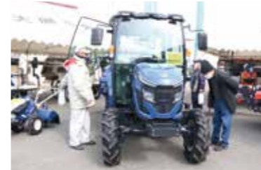
新型トラクターを見る来場者

2月21日、22日、貝原農機センターで農機展示会を開催しました。会場には、トラクターや草刈機など大小さまざまな農機具がズラリ。来場者は農機具メーカーやJA職員から取り扱い方法などの説明を受けていました。