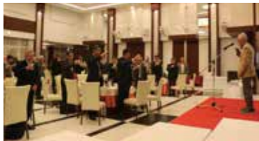
三木・別所産山田錦で醸した日本酒で高らかに乾杯

三木・別所山田錦部会は3月7日、三木市のメゾン・ド・リヴァージュで第20回総会を開きました。生産者をはじめ、三木・別所産山田錦で酒造りをする永井酒造(株)、浅間酒造(株)、JA職員などが出席。次年産の良質な酒米・日本酒づくりに思いを固めました。