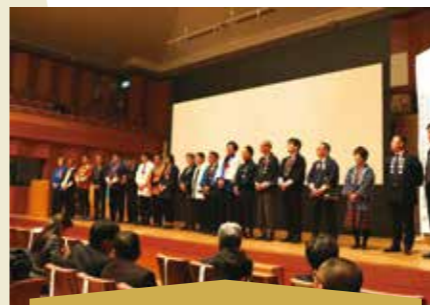
加東酒米生産者大会

加東酒米部会では「加東酒米生産者大会」を開催しています。地元生産者をはじめ、加東市産山田錦を使って酒造りを行う酒蔵などが出席し、栽培技術や品質向上と契約数量の確保に向けて、意思統一を図っています。