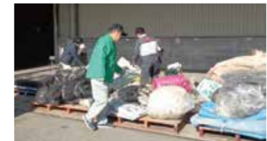
各会場には、不要となった育苗箱や肥料袋、古くなったハウスのビニール、農薬などが多数持ち込まれました

JAみのりでは、毎年、各行政や農薬処理会社等と連携を図りながら、農作業で不要となった農業用廃プラスチックや不要農薬の回収を行っています。今年は、2月15日、22日に各地区で実施。2日間で廃プラスチック約14tと不要農薬約2tを回収し、適正に処理を行いました。