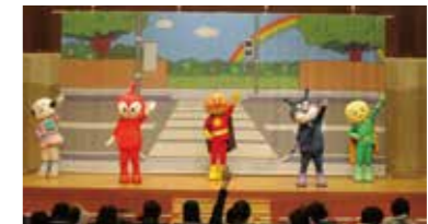
アンパンマンたちと一緒に交通ルールを学びました

JAみのりとJA共済連は2月8日、「JA共済アンパンマン交通安全キャラバン」をやる国際学習塾で開催しました。保護者と子ども合わせて300人が参加。アンパンマンたちは歌や踊りを通じて、信号の色や意味などを子どもたちに伝えました。