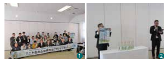
①②2月23日にお披露目会が開かれ完成を祝いました

今年2月までに二十歳を迎える学生が1年を通して日本酒づくりに携わる「二十歳の山田錦物語」がクライマックスを迎えました。今年も1年間の思いの詰まった日本酒「純米大吟醸『二十歳の山田錦物語』」ができました。