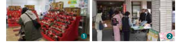
①会場に華やかに飾られたひな壇②JAブースでは募金活動や酒粕の配布、多可産山田錦を使った日本酒のPRなどを行いました

3月1日、八千代地区ふれあい委員会と八千代交流広場推進協議会は「やちよつながらひなまつり」を開催しました。フリーマーケットやひな人形の展示をはじめ、八千代小学校ささゆり鼓笛チームなどによるステージイベントも実施し、たくさんの来場者でにぎわいました。