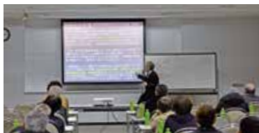
「ふれすこ」は、これからも安全で安心な商品を消費者にお届けします

3月21日、小野市うおい交流館エクラでJAみのり・JA兵庫みらい合同の農産加工品出荷者研修会を実施。ふれすこ出荷者らが食品を取り扱う上での基本的な衛生管理の重要性やHACCP制度の概要などについて学びました。