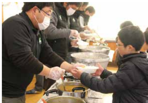
黒田庄和牛入りの特製カレーを受け取る子どもたち

JAみのり青年部西脇支部では、西脇小学校の3年生の子どもたちに毎日食べているお米ができるまでの作業を体験してもらおうと、一年を通して田植えから稲刈りまでの作業を体験してきました。2月7日は、西脇小学校で総仕上げとして開かれた「お米の収穫祭」に青年部員5人が参加し特製カレーを振る舞いました。子どもたちは「お米が甘くておいしかった」「いつものカレーよりおいしい」と笑顔を見せました。