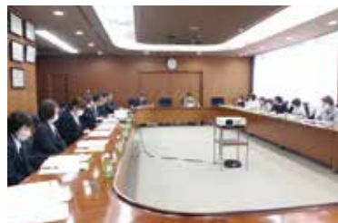
みのりJA女性会は令和7年度も活動を活発に行っていきます

2月17日、みのりJA女性会は「本部理事・JA常勤役員合同会議」を本店で開催。女性会本部役員とJA役員が出席し、令和6年度の女性会活動の報告を行ったほか、より一層の活動の充実に向けて意見を交換しました。